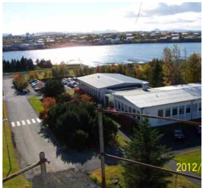
Yfirfarin járnabinding plötu fyrstu hæðar. Hálfur heimur fyrir augum.