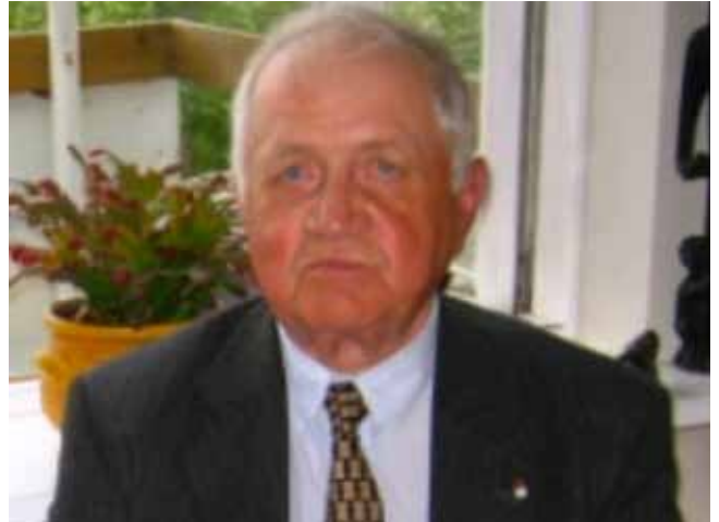
Formáli og samantekt ritstjóra EGJ.