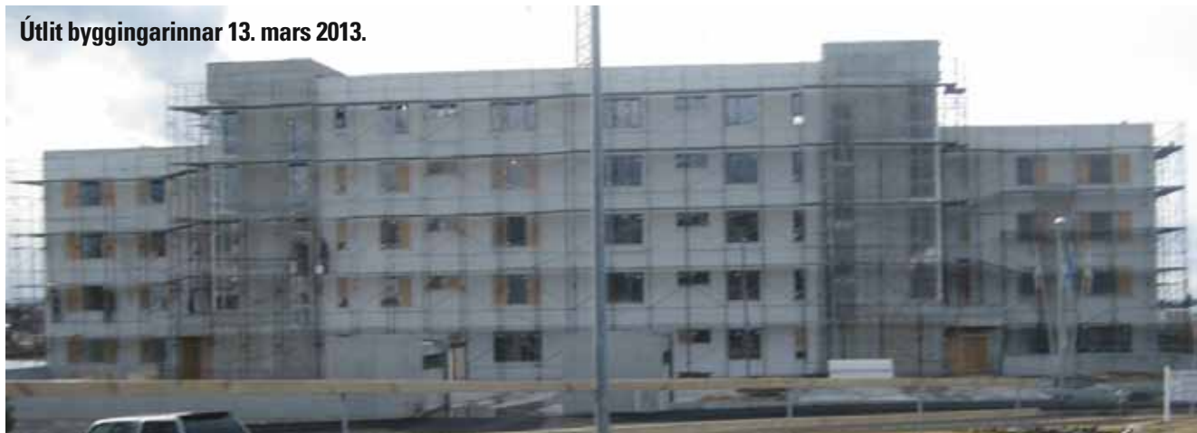
Útlit byggingarinnar 13. mars 2013.